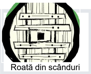
Roată din scânduri

Primele roți erau făcute din scânduri îmbinate între ele și tăiate pe margine în formă de cerc. Roata ușoară, cu spițe, a fost o descoperire